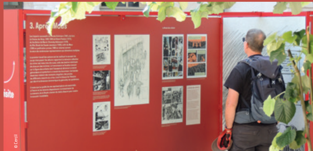
Visite libre de l'exposition temporaire "Shoah et bande dessinée"

Réservation conseillée 02 38 42 03 91 / cercil@memorialdelashoah.org